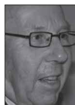
■ MARC GEVAERT

'Na Doryleum maakten wij een grote buit', vertelt een kroniekschrijver die het allemaal heeft meegemaakt, 'goud, zilver, paarden, ezels, muilezels, schapen, ossen en andere waardevolle voorwerpen.' Toen hij tegen de Turken optrok, droeg graaf Robrecht volgens dezelfde kroniekschrijver 'een zijden standaard'. Van een leeuw op die standaard is er op dat ogenblik nog geen sprake. Was één van die waardevolle voorwerpen die graaf Robrecht meebracht naar Vlaanderen misschien een wapenschild met een leeuw erop? Wie zal het zeggen.