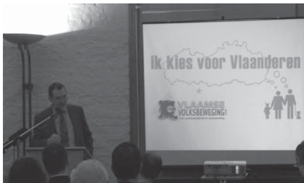
De Vlaamse Volksbeweging, op zoek naar Vlaamse kiezers, startte haar campagne in Brugge